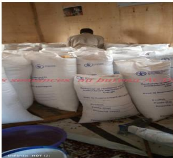
Photo illustrative du passage de la coordonnatrice de COMEQUI Belgique en visite d'évaluation d'activité du programme de sécurité alimentaire via le rendement de la production agricole au bureau de l'ACDDA qu'il finance.